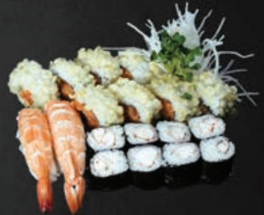
236. Ebi Set A,B,C,G,K 17,9

2 Ebi Nigiri, 6 Ebi Avocado Maki, 8 Crunchy Ebi