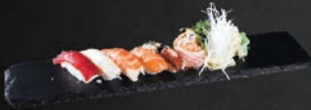
233. Nigiri Set A,B,C,D 15,9

2 Sake Nigiri, 6 Sake Avocado Maki, 8 Salmon I-O