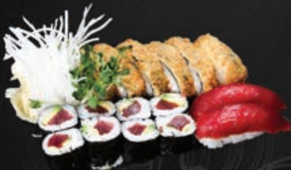
234. Tuna Set A,C,D,G 17,9

2 Ebi Nigiri, 6 Ebi Avocado Maki, 8 Crunchy Ebi