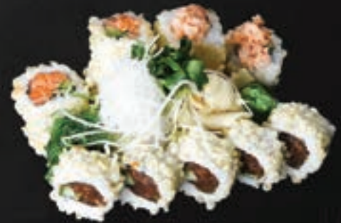
237. Crunchy Set A,B,C,D,G,K 16,9

2 Tuna Nigiri, 6 Tekka Avocado Maki, 6 Tuna Tempura Roll