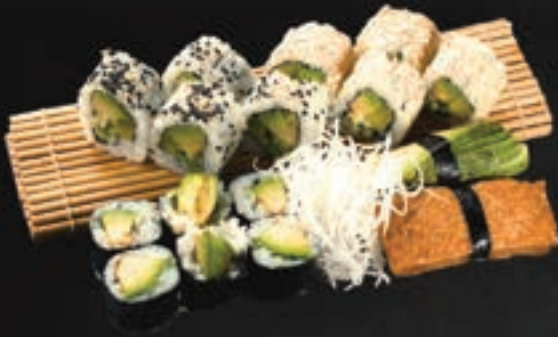
232. Veggi Set A,K 15,9

(Alle Sushi-Sets werden mit Soße verfeinert/ all sushi-sets are glazed with sauce)