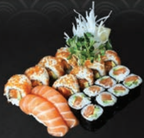
235. Salmon Set D,G 16,9

2 Nigiri (Tofu, Avocado), 6 Avocado Maki, 4 Veggie I-O, 4 Crunchy Veggie